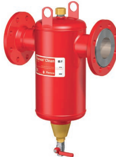
Flamco Clean F