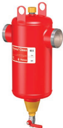
Flamco Clean S